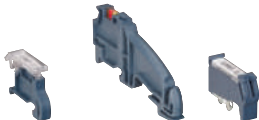
375 11 avec porte-étiquette 395 96