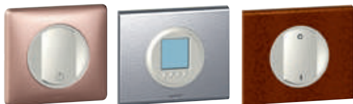
670 51 (Mica)