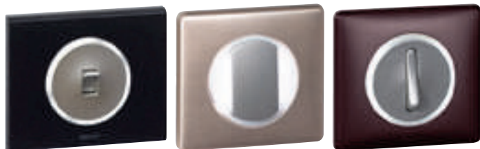
670 16 (Corian nocturne) équipé d'un enjoliveur avec voyant 683 10